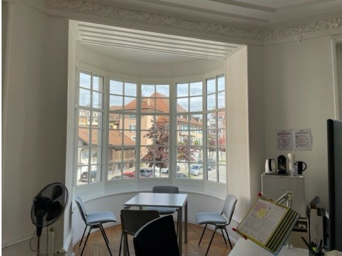
Bureau très lumineux