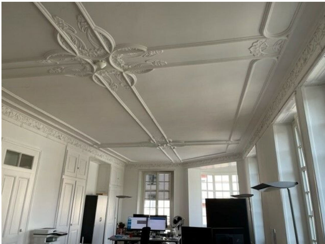
Belle hauteur de plafond