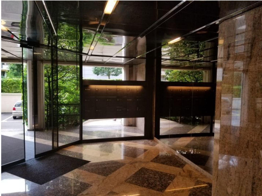
Hall entrée immeuble