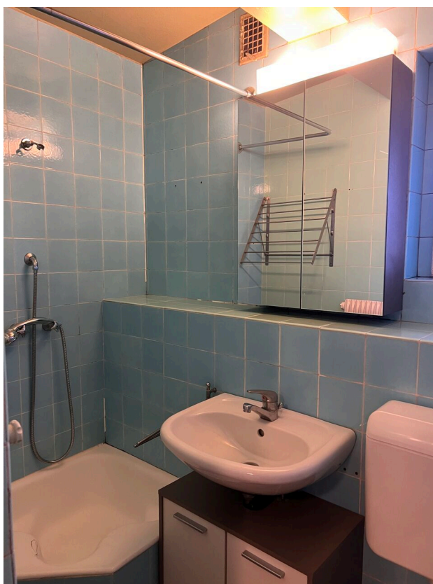
Salle de douche