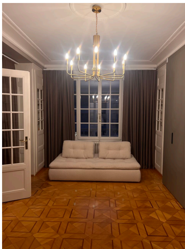
Séjour/Salle à manger